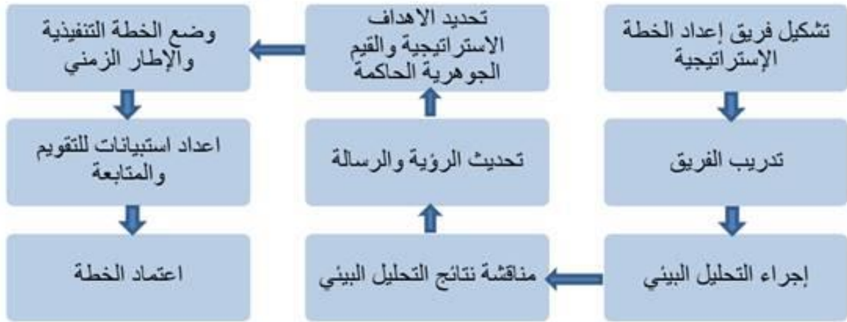
- شكل توضيحي لمراحل إعداد الخطة الإستراتيجية

تم رصد الوضع الحالي للمعهد لوضع الخطة الاستراتيجية للوصول إلي الأهداف المأمولة. معتمدة على أسلوب " S.D.T.P. " " يري - يرسم - يفكر - يخطط". وذلك لرسم صورة مستقبلية مع التفكير للتخطيط وتبني خطة لتحقيق المستقبل بمنهجية. وقد مرت مراحل إعداد الخطة الإستراتيجية بداية من مرحلة تشكيل الفريق و تدريبه ومرورا بتحليل الوضع الراهن وصياغة الرؤية والرسالة والمحاور الأساسية للخطة وتحديد الأهداف الإستراتيجية والتوعية منتهياً بصياغة الخطة التنفيذية وتقدير الموارد المالية اللازمة للتنفيذ ثم المراجعة والإعتماد .